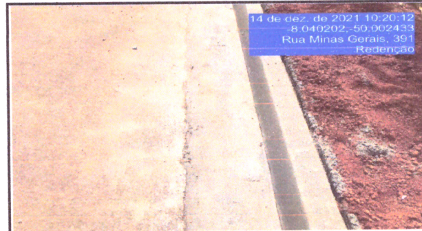
Localização Serviço Rua Minas Gerais meio-fio e sarjeta