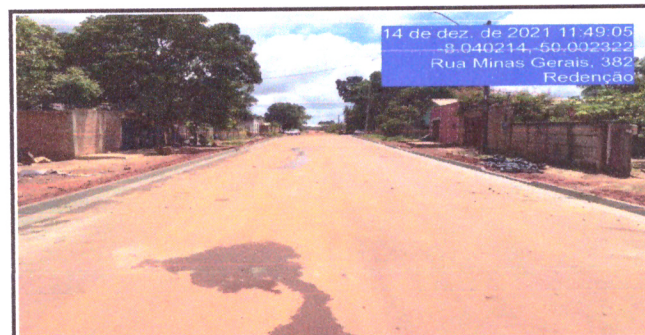
Localização Serviço Rua Minas Gerais meio-fio e sarjeta