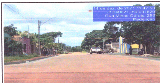
Localização Serviço Rua Minas Gerais meio-fio e sarjeta