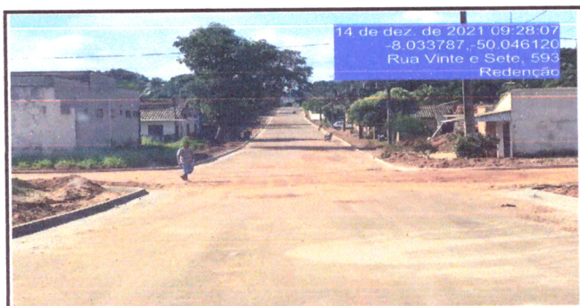
Localização Serviço Rua 27 meio-fio e sarjeta