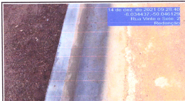
Localização Serviço Rua 27 meio-fio e sarjeta