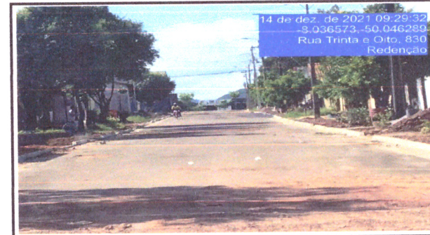
Localização Serviço Rua 27 meio-fio e sarjeta