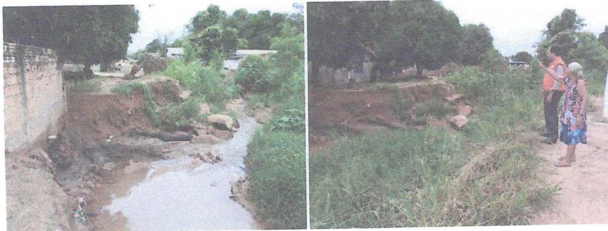
Canal transbordou com o volume de água fora do normal e avançou contra uma residência a qual teve sua fossa estourada prejudicando os moradores do local.

Obs: As metas 1 e 5 foram retiradas do registro fotográfico, bem como do PDR- Plano Detalhado de Resposta, em virtude das pontes terem sido restabelecidas em parceria com os moradores da região.