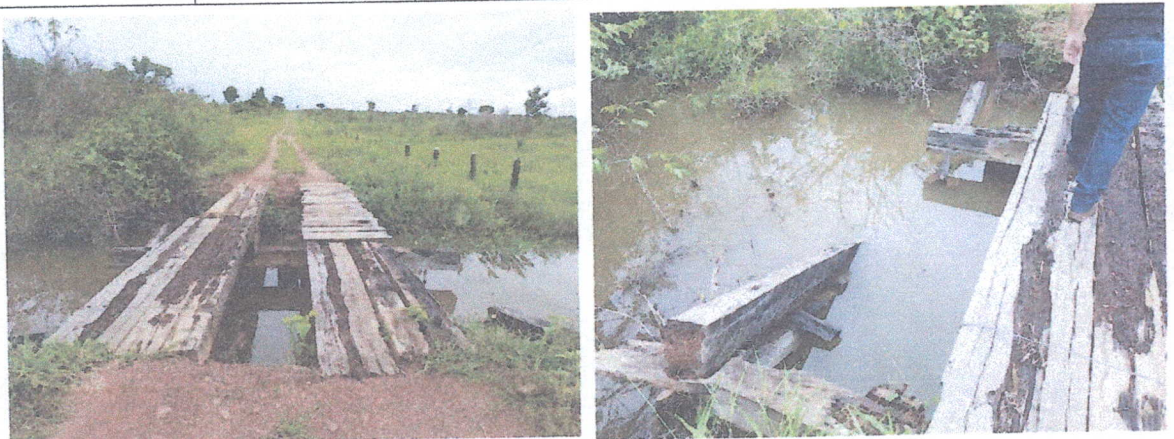
A Ponte foi impactada pela a ação da forte enxurrada, causando interrompendo o trafego no local.