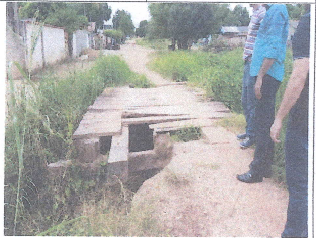
Ponte impactada pela enxurrada a qual encontra-se impedindo o trafego da população pelo local