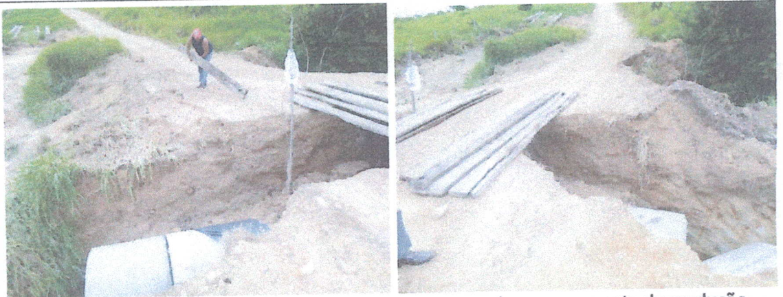
Bueiro impactado pelo desastre impedindo o transporte escolar e escoamento da produção.