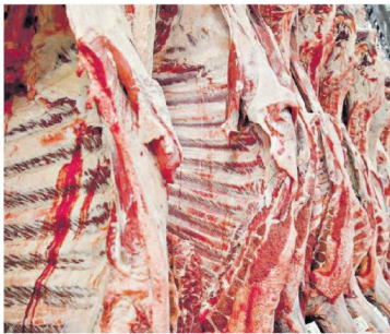
Alimentos como carne bovina e trigo tiveram alíquotas reduzidas