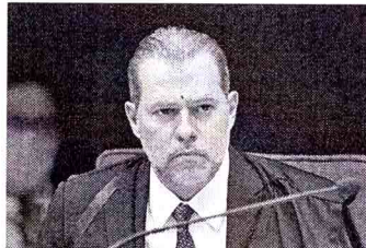
Dias Toffoli: a Constituição Federal garante o direito fundamental ao salário mínimo.

Toffoli destacou que, neste caso, as servidoras são concursadas, o que as impede de acumular cargos, empregos e funções